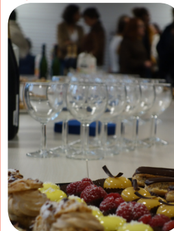
Départ en retraite

C'est ainsi que l'ensemble du personnel s'est réuni en novembre autour d'un verre et de petites mignardises pour saluer le départ en retraite de plusieurs salariés présents au sein de notre association depuis de longues années.