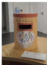
La boîte à questions

Vous pourrez trouver à l'accueil de l'UDAF d'Indre-et-Loire une boîte à questions.